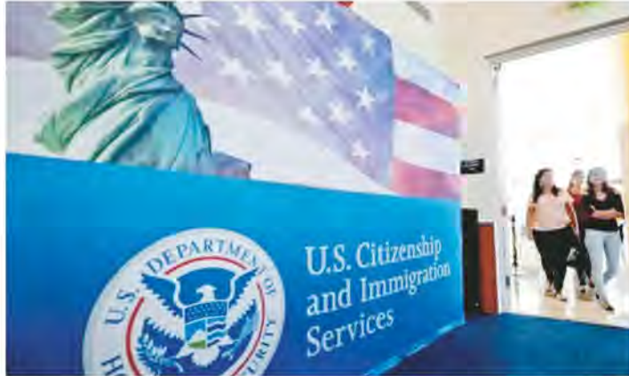
▲移民局可以在優先日期尚未排到前採取他們認為合適的行動，例如發出資訊通知。

讀者問：我的I-485突然變成「案件仍待處理」。這是怎麼回事？我在2023年10月申請了EB-2，後降級為EB-3，同時申請了I-485，並提交了體檢資料。在2023年11月下旬打了指紋，終於等到2024年3月底，I-140降級獲批，但我收到了體檢的RFE(補件)。4月，我重新提交了體檢資料，案件狀態在NBC停留了很長時間。7月，狀態更新為「案件仍待處理」。我的優先日期是2020年6月，A表顯示排程已到，那為什麼會仍待處理？7月後的一周，我收到了美國移民局的信，說簽證配額已用完沒有了，案件再