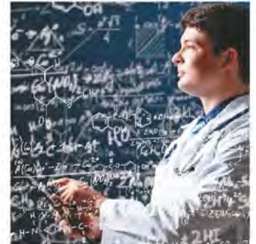
◆EB-1A移民簽證的簽證對象為在科學、藝術、教育、商業或體育等領域享有傑出成就的人士。

事實上，這本雜誌向你收費來採訪你，這並不是大多數知名雜誌都會做的事情。你可能需要進一步調查該雜誌的真實性，以確定它是否是中國真正受人尊敬的出版物。它能否真正說服美國移民局，一個很大的因素是它是否具有國際聲譽。