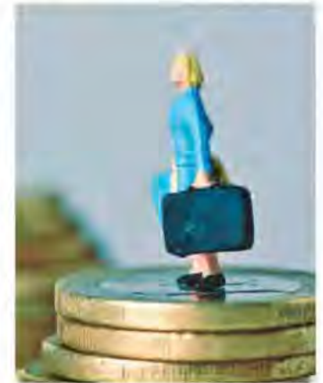
◆獲得美國永久居留權後，必須在雇主那裡工作一段時間。

「移民信箱」僅提供一般性信息，並非律師事務所對客戶個案的正式法律諮詢，不一定適用所有情況。咨者與讀者不存在律師與客戶的關係。——編者