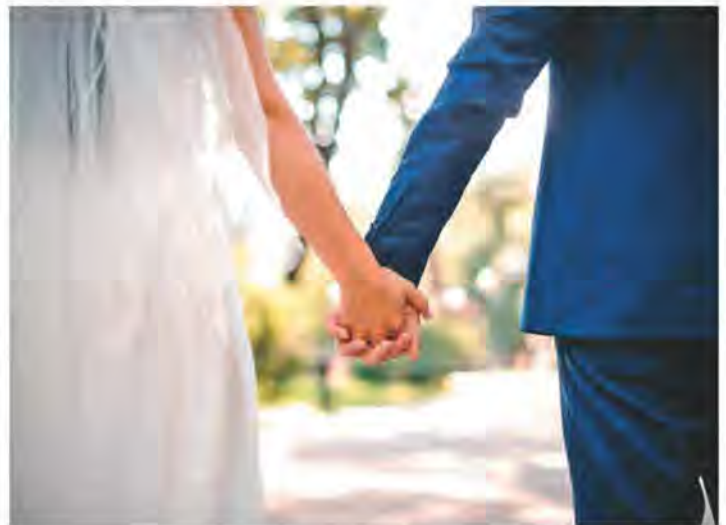
▲美國移民局或美國領事館，會對在永久居留權快拿到時才結婚的案件更加懷疑。

答：基本原則是，加入申請的特權或加入案件的資格在主申請人獲得永久居留權批准時終止。話雖這麼說，美國移民局或美國領事館往往會對在永久居留權快拿到時才結婚的案件更加懷疑。至於你的具體想法，你是對的，你的EB-2不可轉讓給你的妻子。你妻子提交並獲得批准的NIW申請，將為她提供一個優先日期，該日期可以轉移到以後的EB-1申請中。如果你正在做一個案件，而你的配偶正在做另一個案件，則這些案件是彼此獨立，家屬可以在I-485或領事處理階段加入。如果你選擇晚婚，與早婚相比，你的結婚情況可能會受到更嚴格的審查。