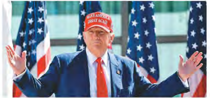
▲川普一反過去反對移民的立場，改口主張想讓在美國大學畢業的外國留學生可自動獲得綠卡。

川普曾經於2017年上任後簽署「購買美國貨、雇用美國人」（Buy American, Hire American）行政命令，指示內閣成員提出改革建議，確保商務簽證只頒發給收入最高或者技能最高的申請者，以保護美國勞工。