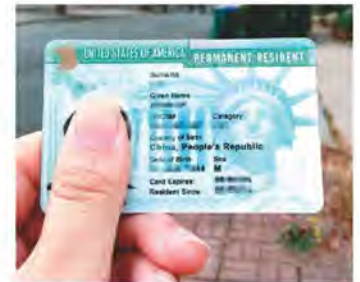
◆拿到綠卡也不大可能立刻去美國工作，應如何考慮。(本報資料照片)

如果一切順利的話，EB-1A案件大約需要2至3年，因此，如果你現在提出申請並成功，你將必須弄清楚如何在你的孩子入大學的年齡之前保留你的綠卡7至8年。◆