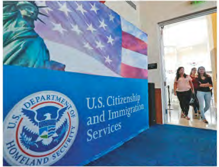
◆提交I-485表格後，未提前申請回美紙，你不得離開美國。

請注意，提交I-485表格後，未提前申請回美紙，你不得離開美國，除非是H-1B或L-1簽證。如果不是這兩種類別回美紙未獲批准就離開會導致你的I-485申請被取消。◆