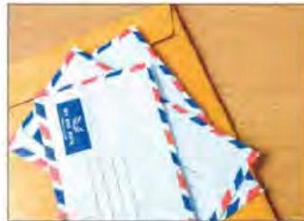
◆ 移民局網站上列出兩個送件地址，因在中國申請，目前尚不清楚最終會去哪個州工作。可以怎麼填？

如果你自行申請EB-1A的I-140，你可以指定你計畫在美國居住的州作為你的主要工作場所。如果你不確定，那麼可以指定你最有可能在美國居住的州。然後，你要查看這個送件地址，選擇與你計畫居住州對應的地址(你也將該地址列為你的工作場所)。當你進行領事面談時，如果你的地址、工作地點與I-140申請中計畫的地址、工作地點相同，那當然是理想的；但即使