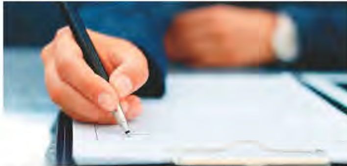
申請旅遊簽證時填寫了不真實的雇主，後來的H-1B簽證、PERM或I-140申請，都如實填寫雇主，會影響辦綠卡嗎？

我目前正在準備I-485調整身分的表格，但我過去申請簽證的工作經驗有些不一致。2010年申請旅遊簽證時，我在DS-160申請表上填寫了我父親的公司名稱作為我的雇主，但當時我實際上在一家美國公司工作。由於這家美國公司在中國沒有分支機構，所以並沒有幫我繳交退休金保險。然後，我就加入了父親的公司來繳我的退休金保險。後來我申請L-1簽證的時候，我就填寫了那家美國公司為雇主。此後，無論是H-1B簽證、PERM或I-140申請，我都如實填寫這家美國公司作為我的工作經驗。現在我擔心美國移民局在審查我的I-485申請時會發現這種不一致。請問，若遇到這種情況該怎麼辦呢？