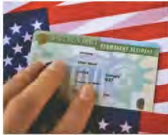
▲EB-3此類簽證處理速度緩慢，通常需要三至五年才能完成。

、是否能夠繼續活躍於國家利益豁免（NIW）的領域，以及如果無法獲得J-1豁免，在中國完成兩年居留時間可能對你案件產生的影響。