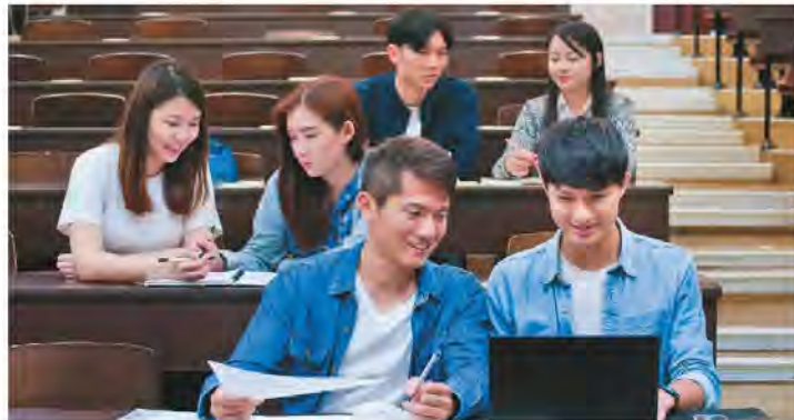
▲如果持有工作簽證，只要每周工作满40小時，就可以接受非全職教育。

然就可以兼職學習，儘管這在大多數情況下會剝奪你工作的機會，除了CPT，最終的OPT和校內兼職工作。如果你處於F-1身分並且擁有