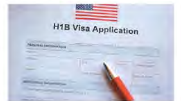
▲如果擁有已批准的I-140，在某些條件下，H-1B在第六年之後仍有資格申請延期。

如果你擁有已批准的I-140，在某些條件下，你可能在第六年之後仍有資格申請延期，而無需離開美國（或幾年後再返回美國）。假設你的優先日期還沒有排到，但你有已批准（未被撤銷）的I-140，你可能有資格獲得三年的H-1B延期或轉換公司。如果你擁有未撤銷的已