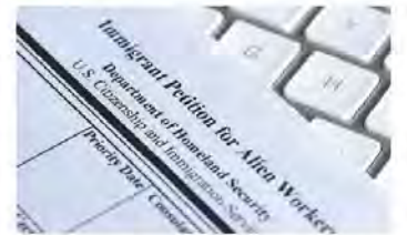
▲如果尚未申請調整身分，I-140申請是不會授予旅行特權。

你有義務在非移民簽證申請中，說出你是否曾經申請過移民簽證的申請。如果你已經以EB-2類別申請了I-485，想知道你是否可以在使用相同的PERM勞工紙來申請EB-3