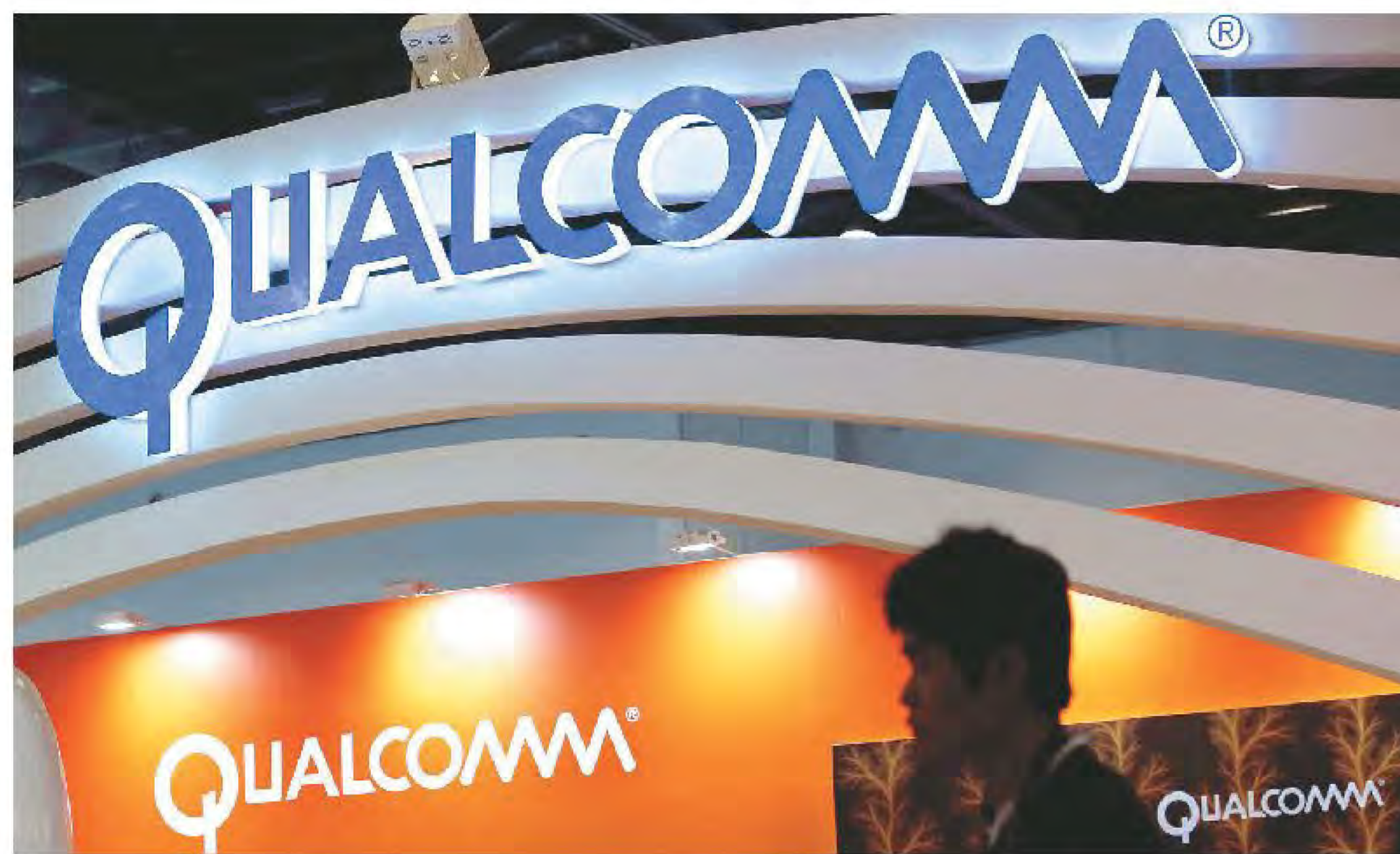
◀ 在高通公司做芯片驗證的敏感工作，會影響H-1B申請嗎？

官員的自由裁量權，以及所提供的任何支持文件。由於你擁有有效期為兩年的護照，以及有效期為兩年的H-1B身分，因此與中國的H-1B互惠計畫中沒有任何內容可以說明