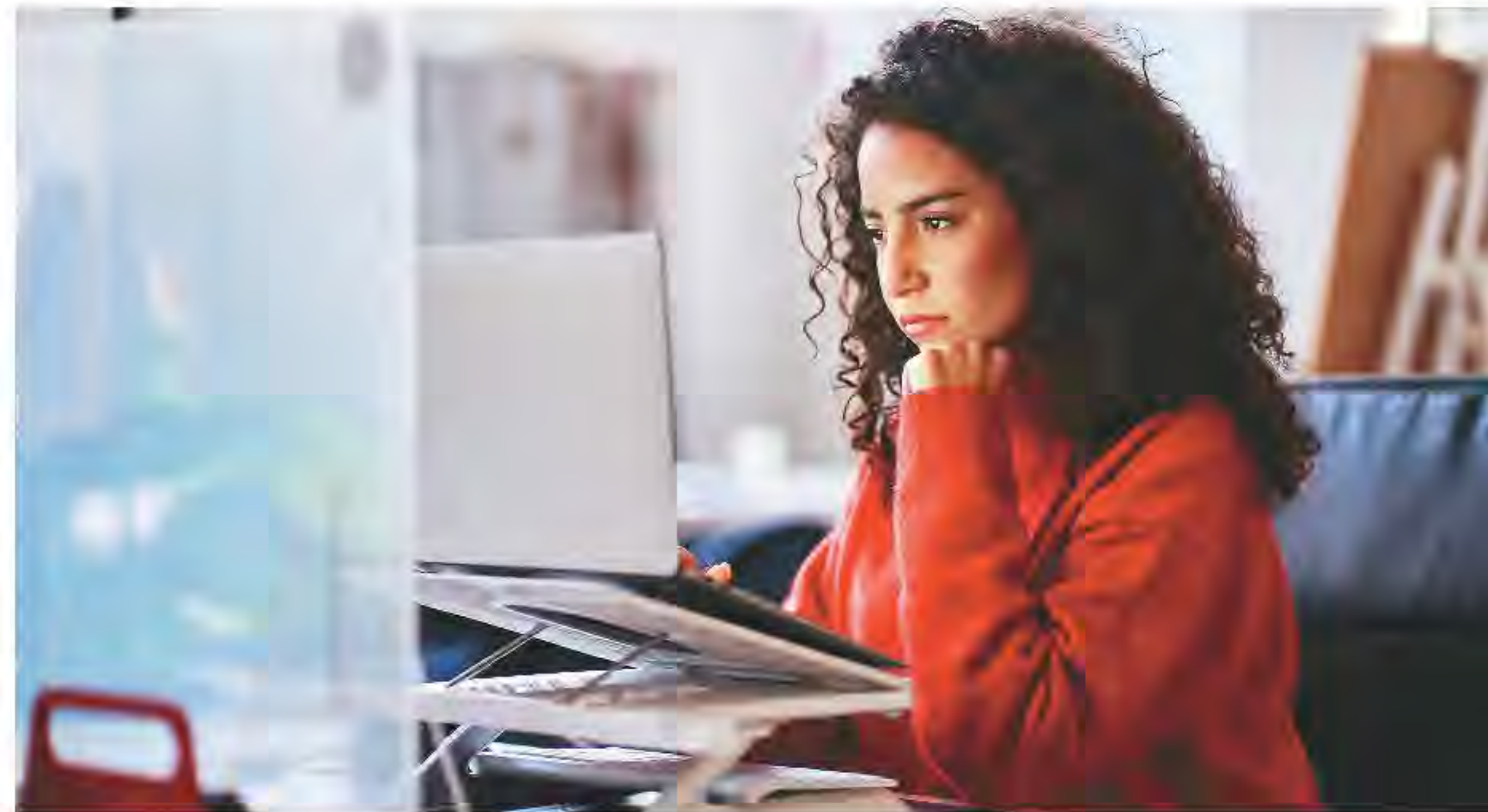
▲現行的F和M非移民學生將不允許在線課程計入超過2023-24學年監管限制的完整課程內。

美國移民委員會高級研究員林德(Dara Lind)在2023年4月19日在「移民日報」發表的一篇文章，題目是「新的美國公民及移民服務局中心