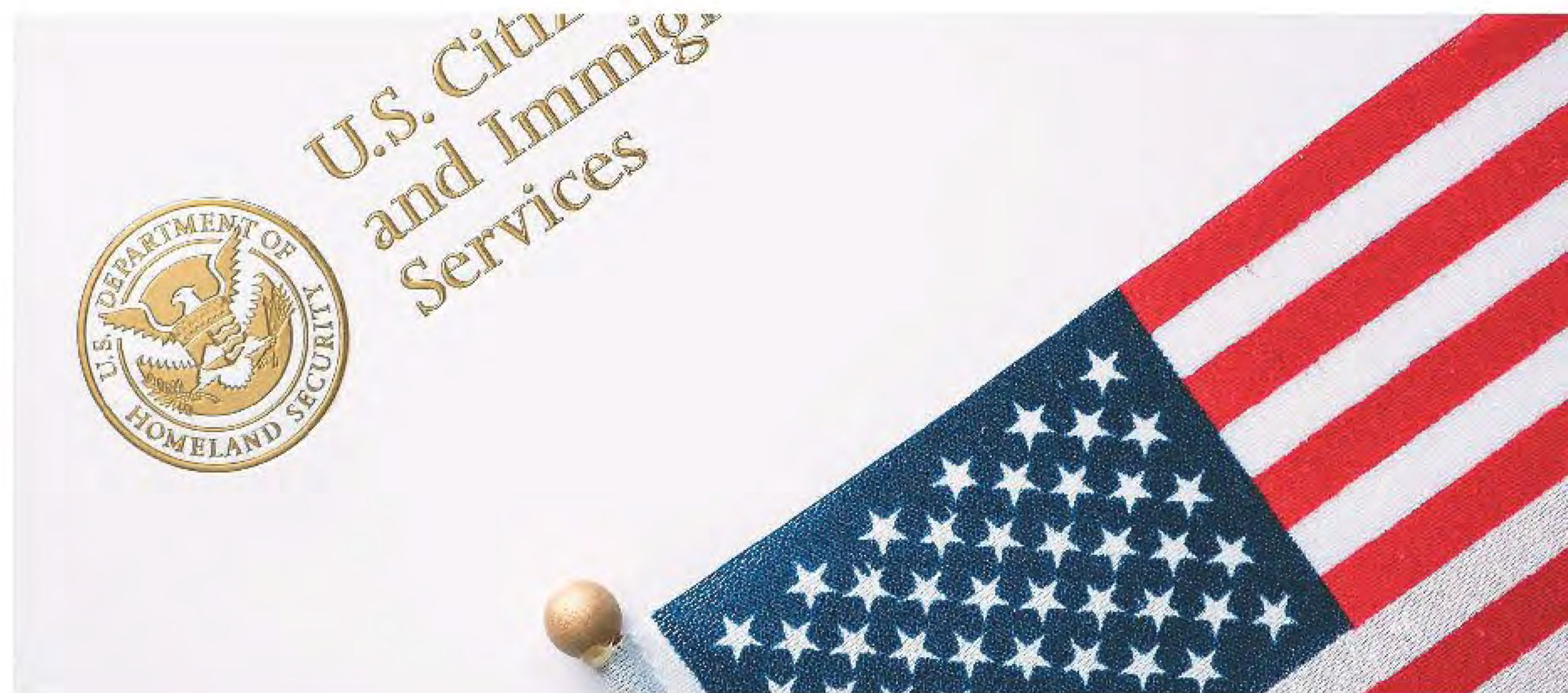
▲家庭成員的組合卡不在同時批准是常見現象。