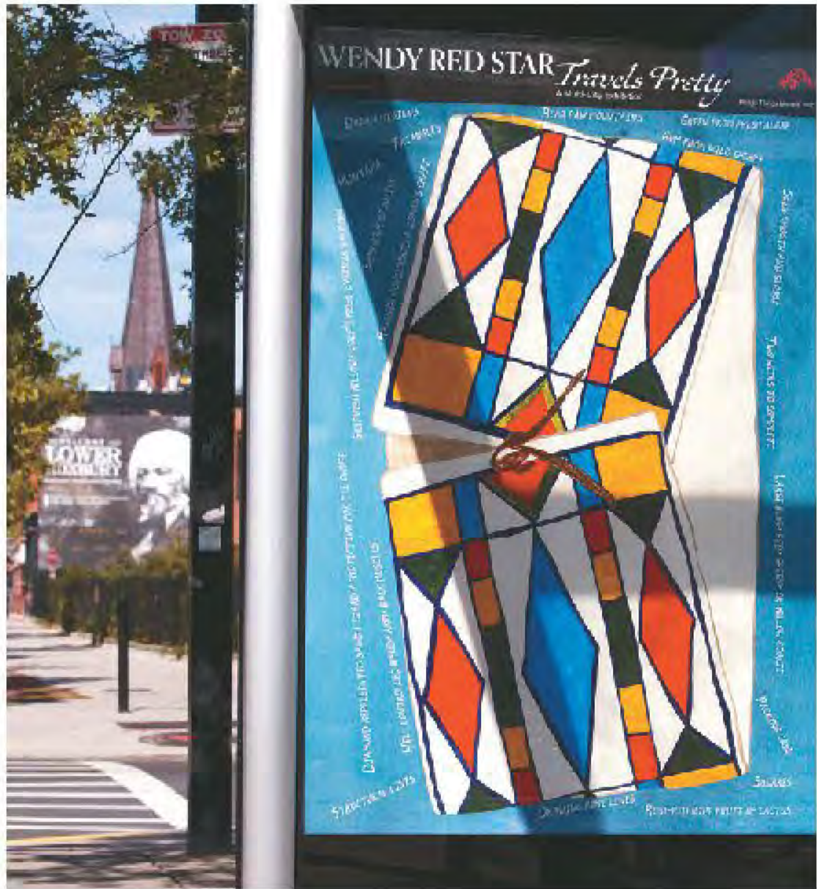
在藝術或科學等有傑出表現者，可申請EB-1A或EB-1B簽證，圖為來自蒙大拿州烏鴉部落的藝術家Wendy Red Star，在麻州波士頓一處巴士站色彩鮮明的作品。

讀者問： 我是西海岸的物理學博士，2020年底畢業後一直在紐約打工。我的文章被引用了900+，有一些新聞報導，審稿兩篇。 畢業後，我就沒有寫文章了。最近，一直在要求雜誌編輯發表一些評論論文的机会。 前兩年，我沒想過綠卡的事，最近才想申請傑出人才EB-1A。律師說我的文章比較舊了，讓我有新文章後再去申請。可是，因為我轉行了，再發文章比較困難。 我想問，這種情況申請國家利益豁免綠卡(NIW)有沒有戲？傑出教授或研究人員EB-1B呢？