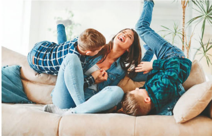
▲公民在海外娶妻生子再回美國，有辦法將家人帶回美國。

看來你符合在美國必要居住的條件（即居住五年，其中至少兩年在14歲之後），可以將美國公民身分傳給你的婚生子女。你應該填寫DS-2029表格，即美國公民子女在國外出生的領事報告，向領事館或