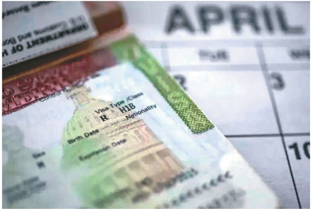
◆在初始抽籤時抽出更多的註冊人員工、提高註冊費等作法，或可改善H-1B抽籤系統。

作者認為這個新系統存在問題。雇主註冊比較容易，因為他們只需將基本信息輸入在線表格並為每位潛在員工支付10元即可。那些在第一輪抽籤沒有被抽中的人，必須等第二次或第三次抽籤的機會（2022